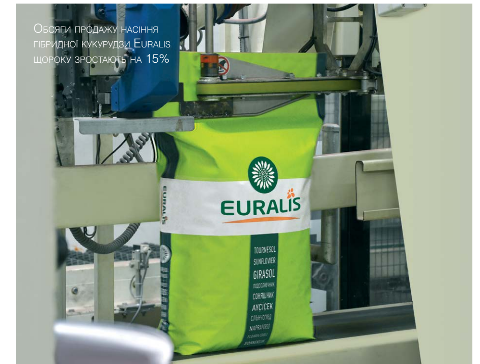
Обсяги продажу насіння гібридної кукурудзи Euralis щорічно зростають на 15%